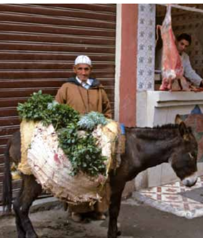
043ma Abb.: ad