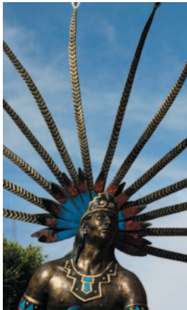
Statue eines Otomí-Tänzers, Querétaro