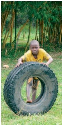
Das Trampolin des Straßenkinderzentrums