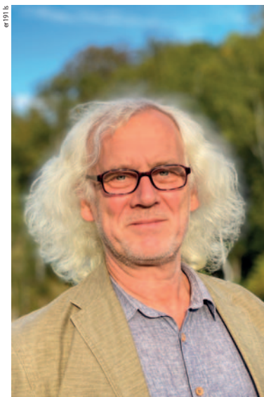
er 1971 is

Der Autor bedankt sich bei seiner ständigen Begleiterin auf den Höhen der Wanderungen und Exkursionen sowie während der Mühen der Ebenen des Schreibens. Besonderer Dank gilt Lothar Sprenger für die Fotos und zahlreiche Anregungen sowie Alexander Ihlau für das technische Hilfswerk.